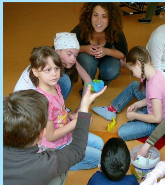
Durch die Erweiterung der Torwiesenschule mit Real- und Werkrealschule kann das „Gemeinsame Lernen“ ab Herbst 2011 auch für ältere Schüler stattfinden.